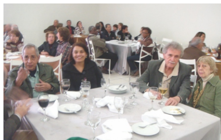
Fotos de encontros anteriores